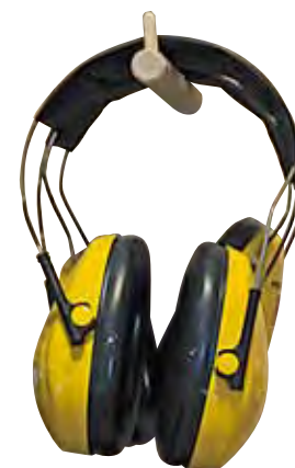
I slöjden finns numera en klassuppsättning hörselkåpor.

GRUNDEN LADES AV OTTO SOLOMON som på godset Nääs utanför Göteborg i början av 1870-talet fick i uppdrag att driva en slöjdskola för pojkar. Snart skulle Otto Solomon starta den första lärarutbildningen i slöjd. Först var den ettårig, men med tiden ändrades upplägget till att folkskollärare skulle komplettera med kortare kurser för att kunna undervisa även i slöjd. Den vägledande